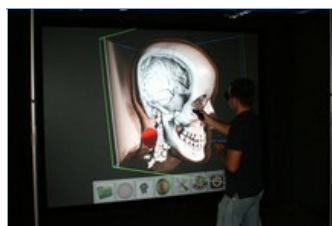
Pared virtual para el estudio de la anatomía humana.

El grupo de investigación en Modelado, Visualización e Interacción en Realidad Virtual (MOVING) de la Universidad Politécnica de Catalunya. BarcelonaTech (UPC) ha diseñado una pared virtual (EsterWall) de altas prestaciones y de bajo coste para visualizar e interactuar con objetos mediante imágenes estereoscópicas. La instalación, que funciona con un complejo software desarrollado por el mismo equipo, es una herramienta idónea para aplicaciones en medicina, diseño industrial y paleontología, entre otros ámbitos.